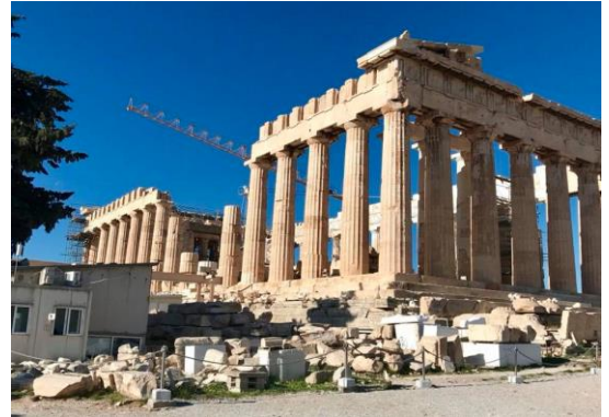
Die Akropolis als Fallbeispiel einer mehrfach umgenutzten aber bestens gelegenen Immobilie!